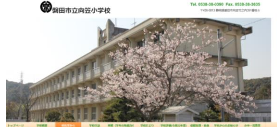
岡田市立向笠小学校 TEL 0538-38-0390 Fax 0538-38-3655

「学校における新型コロナウイルス感染症対策ガイドライン～向笠小版～」も完成次第、アップします!